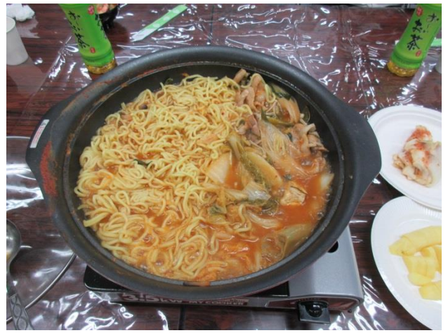
メのキムチラーメン

さて、お食事タイムの後は恒例行事!! 副社長のエレキギターにより第一部開演です!!