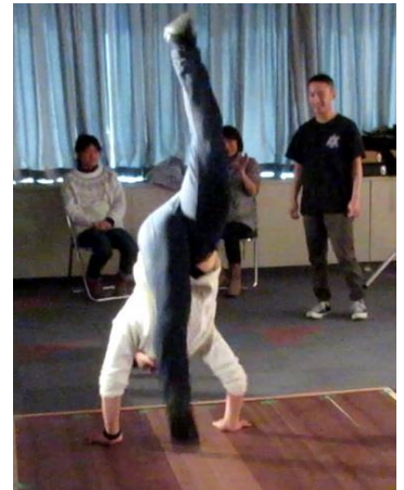
ハンドスプリング!!