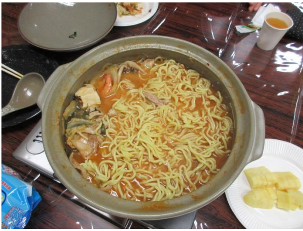
メの味噌ラーメン