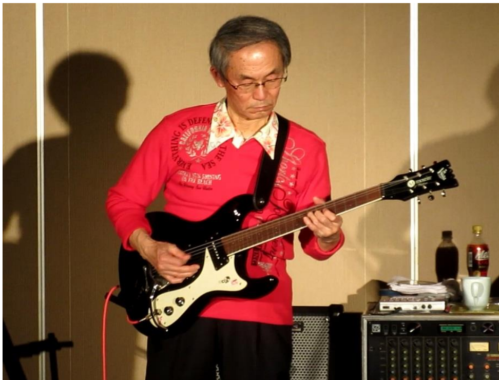
副社長の演奏にて終演!!

あっという間に時間は過ぎ、今回の交流会が終了。 次回の開催もどうなるのか楽しみです!!