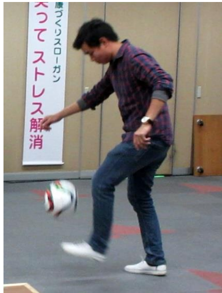
4期生ユイ君も参戦!!