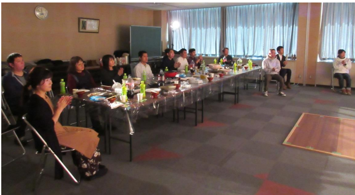
副社長のエレキギターに釘づけ!!