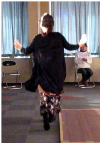
会場設備コンビでヒゲダンス!?